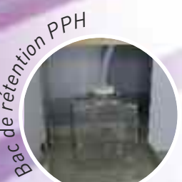
Bac de rétention PPH