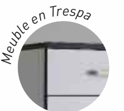
Meuble en Trespa